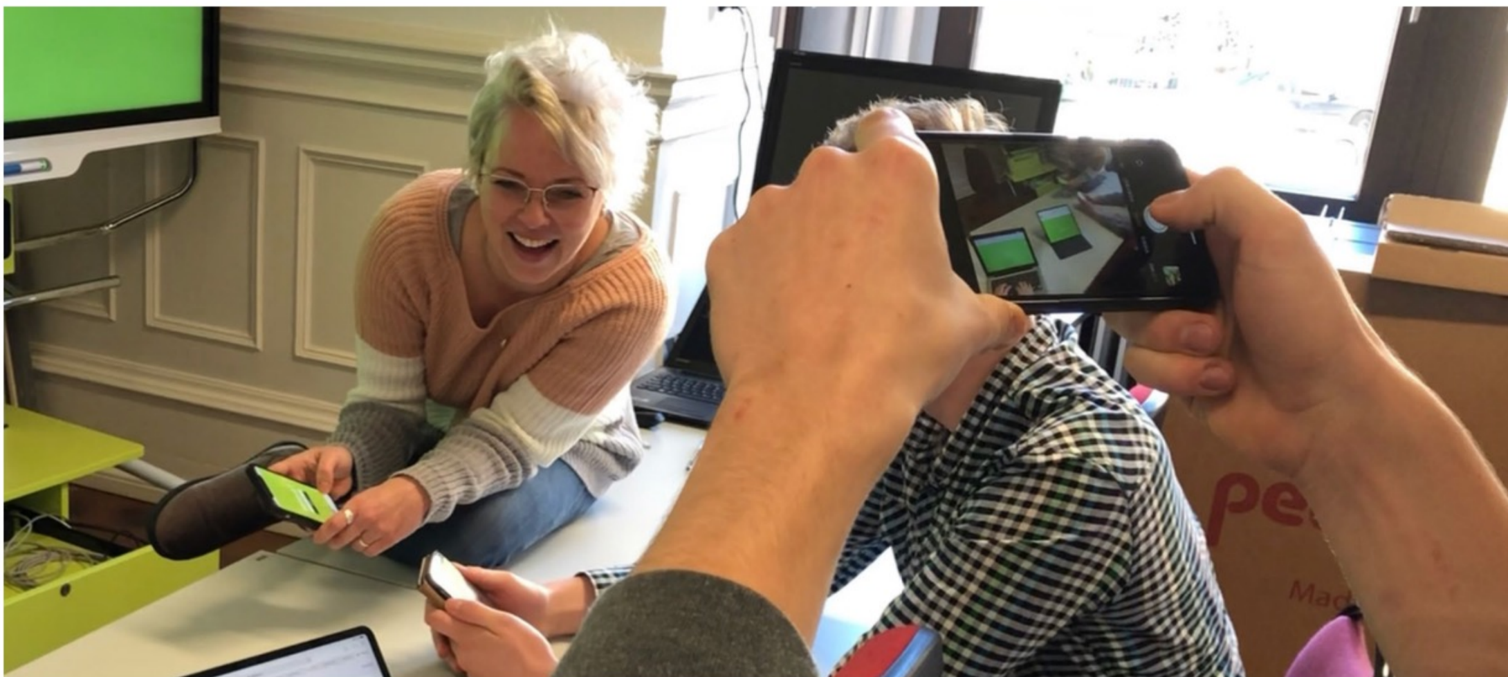
Handlungs- und produktionsorientierte Seminarformate schaffen gute Voraussetzungen für motiviertes, praxisorientiertes und soziales Lernen.

Leon Lukjantschuk | leon.lukjantschuk@zlb.uni-halle.de | dikola.uni-halle.de