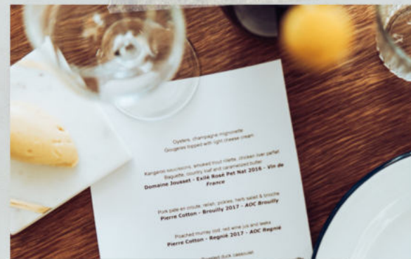
Fase 2: Elegir la comida