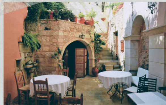
Fase 1: Saludar y sentarse