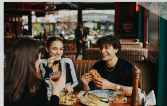
Fase 3: Comer y conversar