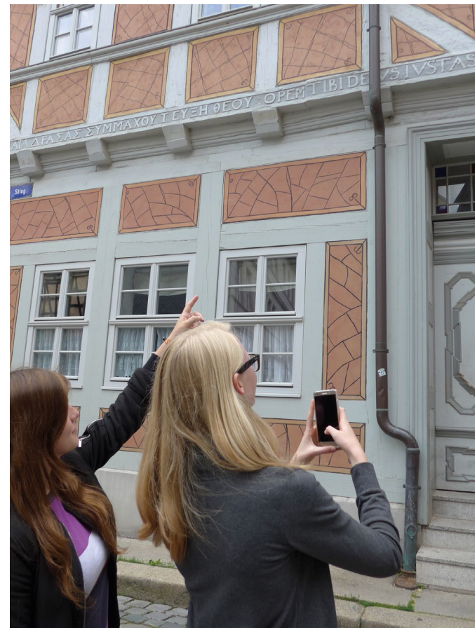
Schülerinnen vor Inschrift

Die App ist so aufbereitet, dass die im Schwierigkeitsgrad variierenden Inschriften bereits mit geringen Lateinkenntnissen übersetzt werden können. Ein internetfähiges Smartphone oder Tablet genügt, um sich anhand einer Karte von Inschrift zu Inschrift durch die Stadt führen zu lassen. Dieser besondere Rundgang ergänzt das reichhaltige touristische Angebot Quedlinburgs und soll überdies dazu beitragen, über den lokalen Bezug die Relevanz der lateinischen Sprache vor allem Lernenden vor Augen zu führen.