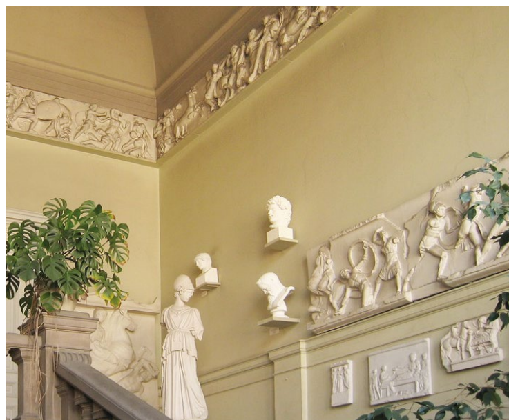
Treppenhaus des Robertinum

In Zusammenarbeit mit der Fachdidaktik der alten Sprachen wurden museumspädagogische Angebote entwickelt, die zum Teil als Quizaufgaben im Rahmen eines Museumsbesuchs genutzt werden können, zum Teil als Basis für die Durchführung von Projekttagen an der Schule dienen sollen. Diese können mit einem Museumsbesuch und einer thematisch passenden Führung verbunden werden, es wird auch Unterstützung bei der Nutzung der Materialien angeboten.