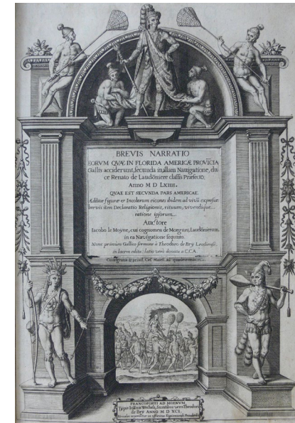
Titelblatt eines Reiseberichtes aus der Werkstatt von Theodor de Bry (1591)