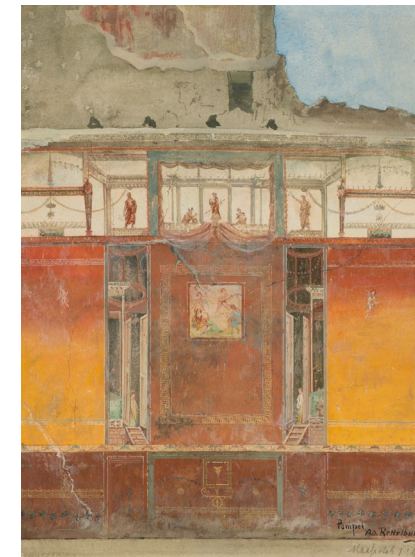
Pompejanische Wandmalerei, Adolf Rettelbusch

Klöster waren im Mittelalter auch für die Schulbildung zuständig. Zunächst gilt es Spuren klösterlichen Lebens in der Dauerausstellung zu entdecken. Anschließend kann die Arbeit in einem Scriptorium, nicht zuletzt das Schreiben mit Feder und Tinte, selbst erprobt werden.