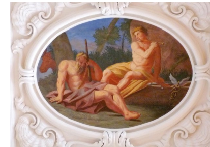
Riesensaal im Schloss mit Deckengemälde „Geschichte der Io“

Ab dem 16. Jh. sind erste Rezeptionen ovidischer Themen in den Wandmalereien des Renaissance-Schlosses nachweisbar. Nach der Erhebung des Schwarzburger Adelshauses in den Fürstenstand entstanden der Riesensaal und Wohnräume mit imposanten Decken- und Wanddekoren, welche im Gewand von Ovids Metamorphosen Fürstenwürde und Staatsmacht huldigen.