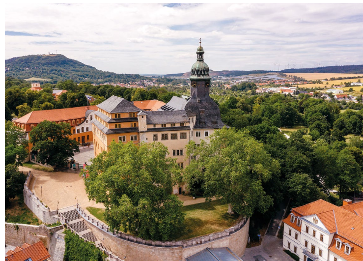
Sondershausen, Schlossansicht

Die weitläufigen Anlagen des Sondershäuser Schlosses präsentieren das bedeutendste bau- und kunstgeschichtliche Ensemble eines Adelssitzes in Nordthüringen. Hervorgegangen aus einer hochmittelalterlichen Burganlage, wurde es im 16. Jh. zu einem Renaissanceschloss, später zu einer barocken Residenz umgebaut und bis ins 20. Jh. erweitert.