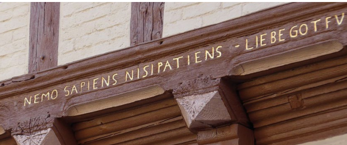
Hohe Straße 25

Um die oftmals versteckten Hausinschriften bei einem Rundgang durch die Stadt zu entdecken und zu entziffern, wurde von Quedlinburger Schülerinnen und Schüler der 10. Jahrgangsstufe des GutsMuths-Gymnasiums eine App entwickelt.