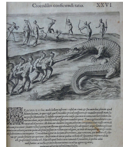
Detail aus dem Reisebericht