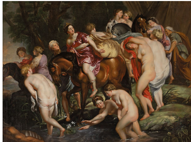
Flucht der Cloelia aus Porsennas Lager (Kopie nach Peter Paul Rubens)

In seinem Garten ließ der Fürst antike Bauwerke nachbilden, wie den Floratempel. Im Schloss stellte er Antiken zur Schau, die er sich aus Italien kommen ließ, aber auch deren Nachbildungen. Zahlreiche Gemälde zeigen Geschehnisse aus der antiken Mythologie oder Geschichte. Darunter ist eine Kopie des Rubens-Bildes „Cloelia flieht aus dem Lager des Porsenna“. Die Antikenrezeption im 18. Jh. lässt sich also an Schloss und Garten Wörlitz in besonderer und vielfältiger Weise abbilden.