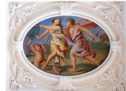
Riesensaal im Schloss mit Deckengemälde „Apollon und Daphne“

Nahezu die Hälfte aller Räume und Malereien zu Ovid sind im Rahmen des normalen Rundganges zugänglich. Die überlebensgroßen Götterfiguren im Riesensaal und in plastischem Stuckwerk eingebettete Decken- und Wandgemälde gestatten eine faszinierende Konversation mit der antiken Mythologie.