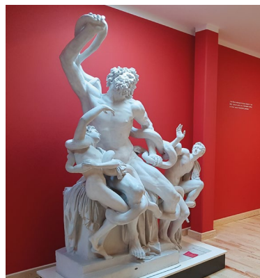
Gipsabguss der Laokongruppe

kammer, Bibliothek und Altar für die Götter des Alltagslebens der Römer. Besucher*innen können antike Musikinstrumente ausprobieren, im Hafen römischen Seehandel kennenlernen und in einer Kreativwerkstatt Vasen nach antiken Vorbildern gestalten. Im Museumspark laden Trojanisches Pferd, Hörtheater, großes Heckenlabyrinth, Archäologen-Camp sowie die Spielstraße mit antiken Spielen zu Workshops ein.