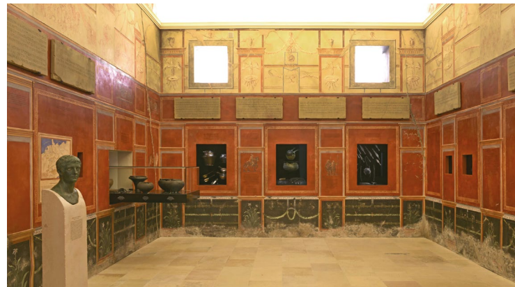
Ausstellungsraum „Die Erfindung der Germanen“