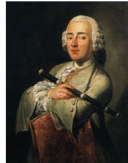
Gleim-Portrait von Gottfried Hempel (ca. 1750)

Anknüpfungsmöglichkeiten beim Besuch des Gleimhauses sind die Themen Aufklärung und Toleranz, Literatur, Kunst, Briefkultur, Freundschaft, Alltag im 18. Jahrhundert, Papier und Bücher, Geselligkeit und Gesellschaftsspiele.