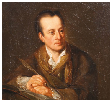
Johann Joachim Winckelmann Portrait-Replik nach Angelika Kauffmann